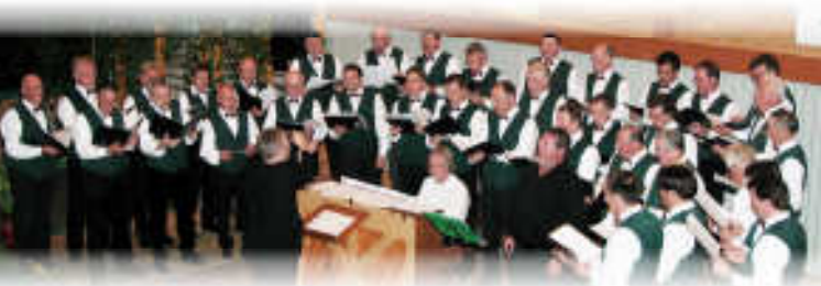
Der MGV "Sängerbund" Altheim bei seinem Jubiläumskonzert im Mai 2010

Erfahren Sie mehr auf www-saengerkreis-buchen.de