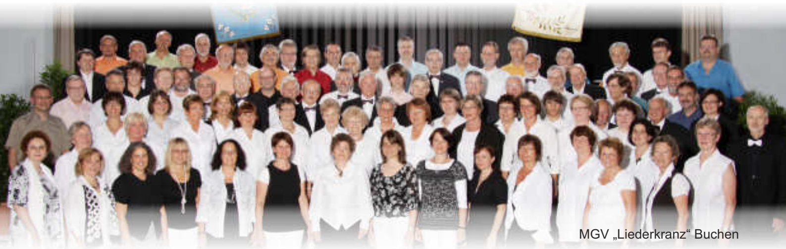
MGV „Liederkrantz“ Buchen