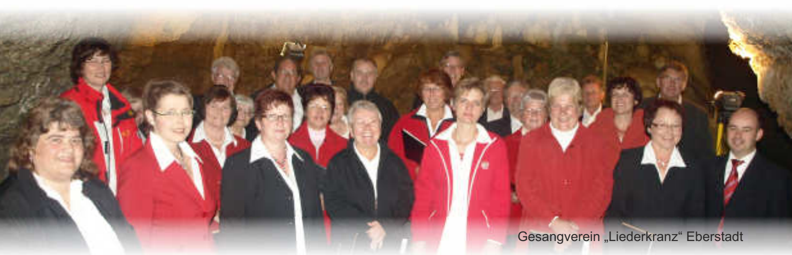
Gesangverein „Liederkranz“ Eberstadt