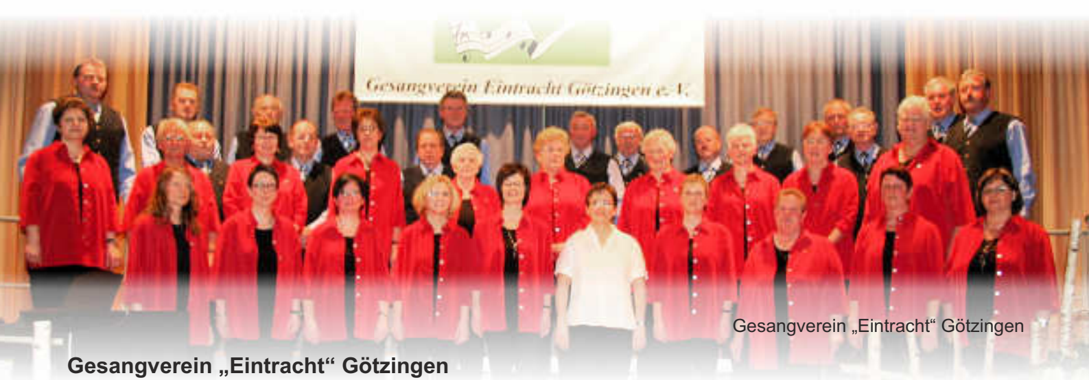
Gesangverein „Eintracht“ Götzingen